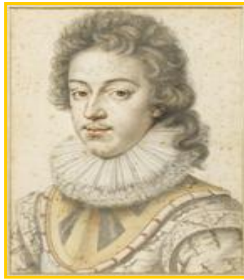
Daniel Dumonstier Inv. PD 383 Portrait de Louis XIII