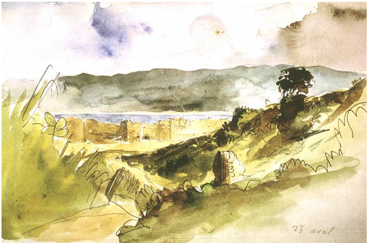
Eugène Delacroix, Paysage