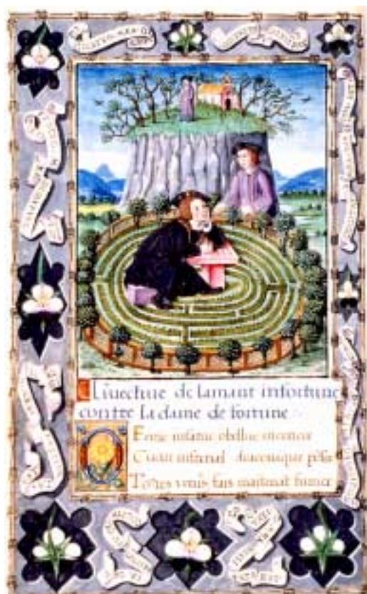
François Habert, L'Amant infortuné . Enluminé à Paris (?), ou à Bourges (?), aux alentours de 1530.