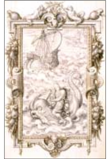
La Suite des œuvres poétiques de Vatel . Paris, calligraphié et orné pour les étrennes de l'année 1574.

Bienvenue au visiteur sur un terrain encore largement inexploré.