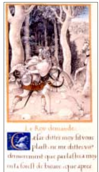
François Demoulins, Les Commentaires de la Guerre gallique , vol. III. Manuscrit enluminé par Godefroy le Batave, Paris, 1520.