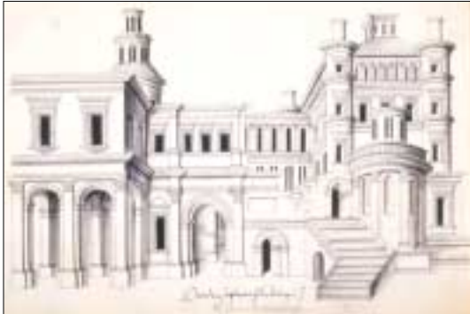
Jacques Androuet Du Cerceau, Album de dessins d'architecture . Orléans, aux alentours de 1550.

Le papier et le dessin envahissent peu à peu le manuscrit de luxe (Vatel, n° 15). Mais la luminosité des peaux soigneusement préparées ne perdra jamais son prestige. Les délicieuses illustrations de la traduction des Troades (n° 12) semblent hésiter entre dessin et miniature. Le bel artiste, quel qu'il soit, qui a dessiné la Géométrie (n° 17) n'est visiblement pas un miniaturiste de métier et il sait mettre en valeur les qualités particulières du vélin de façon assez neuve, peut-être justement parce que cette matière devenait exceptionnelle.