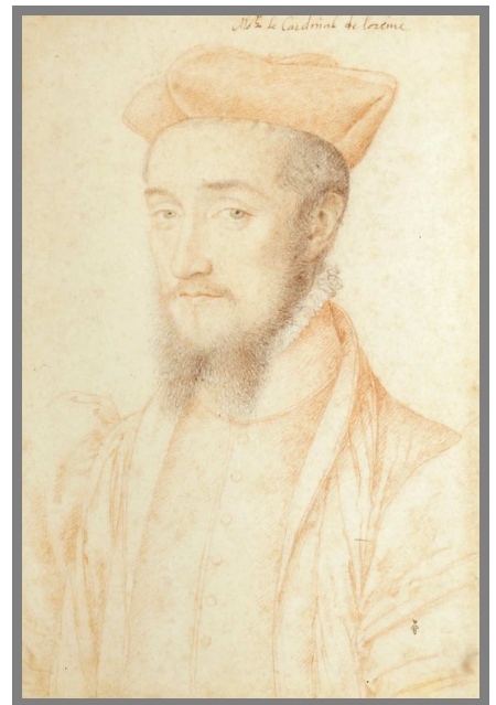
François Clouet (?), Charles cardinal de Guise puis de Lorraine (1525-1574) .