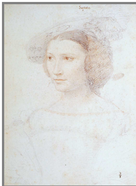
Jean Clouet, Portrait de Léonore de Sapata .

du mercredi 25 septembre 2002 au lundi 3 février 2003