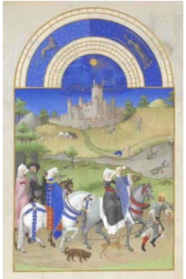
Les Très Riches Heures du duc de Berry , mois d'août (f. 8v)

Au Moyen Âge, avant l'invention de l'imprimerie vers 1450, les livres de dévotion tels que les Très Riches Heures ont été écrits à la main, sur des feuillets de parchemin préparés à partir de peau de mouton, de veau ou de chèvre. Les initiales peintes au début de chaque texte permettaient au lecteur de se retrouver dans le manuscrit, qui était rarement folioté (c'est-à-dire numéroté sur un seul côté du feuillet ; la pagination est apparue en Occident après le XVI e siècle). Les images, destinées à la contemplation, servaient également à souligner le début de chaque heure ou dévotion. Peintes avec des pigments d'origine végétale ou minérale (comme le minium , oxyde de plomb de couleur rouge, dont le nom a produit celui de miniature ), les enluminures furent rendues éclatantes par l'application de métaux : or brun, or peint et argent.