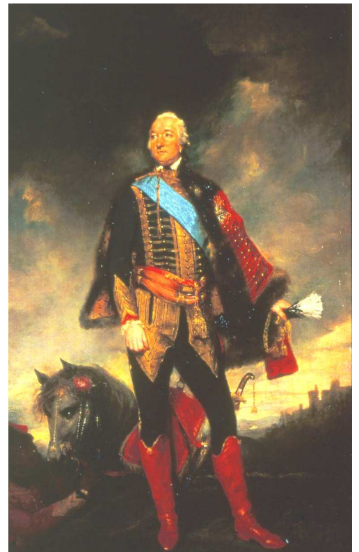
Portrait du duc d'Orléans Philippe-Égalité (1747-1793), Sir Joshua Reynolds.