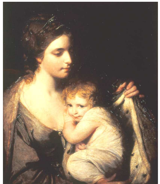
Sir Joshua Reynolds, Portrait des deux Waldegrave, Lady Waldegrave (1739-1809) avec sa fille Elisabeth-Laura enfant.

Une sélection des œuvres les plus remarquables est donc présentée au musée Condé. Parmi les peintures, il faut remarquer celles de sir Joshua Reynolds, de George Romney, de Joseph Highmore, de sir William Beechey, d'Edward Lear, parmi les pastels ceux de John Russell et de l'Irlandais Hugh Douglas Hamilton. Cet ensemble témoigne de la qualité des œuvres conservées par l'Institut mais aussi du goût français pour l'art britannique particulièrement à la fin du XIX e siècle. En effet, si les collections du duc d'Aumale montrent une familiarité séculaire avec l'art de nos voisins d'outre-Manche, celle des Jacquemart-André par exemple, constituée surtout à la fin du XIX e et au début du XX e siècle, est d'une autre nature. Elle fut considérée en son temps, à défaut d'être exhaustive, comme la meilleure collection publique française d'art anglais.