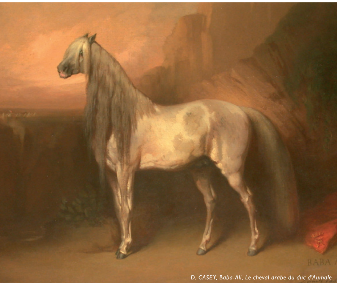
D. CASEY, Baba-Ali, Le cheval arabe du duc d'Aumale

De son voyage, le duc d'Aumale rapporte un goût nouveau pour les tableaux qui illustrent l'Orient et pour les chevaux arabes. Deux raisons sont à l'origine de ce choix.