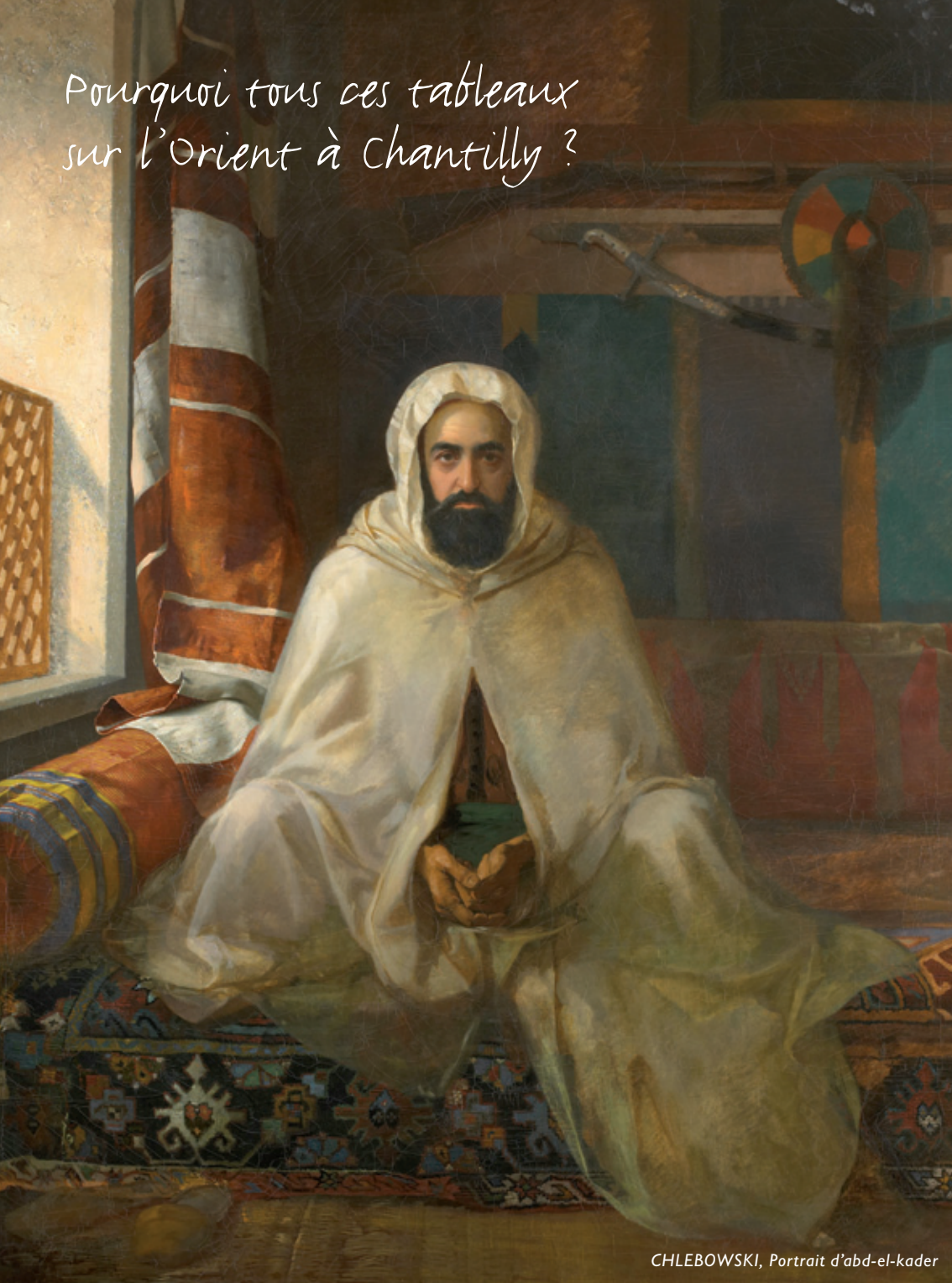
CHLEBOWSKI, Portrait d'abd-el-kader

Pourquoi tous ces tableaux sur l'Orient à Chantilly ?