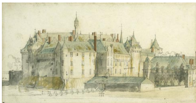
Chantilly vers 1665 par Van der Meulen