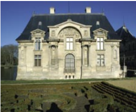
Petit Château (XVI e siècle)

Le connétable Anne de Montmorency, compagnon d'armes de François I er , est propriétaire du château de Chantilly. Suite aux guerres d'Italie, pendant lesquelles il a pu admirer de nombreux palais, il décide de construire un château de plaisance dans le style de la Renaissance française, adaptation du style de la Renaissance italienne.