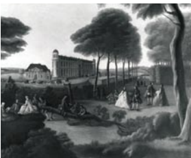
Château de Chantilly avant 1769 Hyacinthe Rigaud

Louis II de Bourbon, leur fils, dit «le Grand Condé», et cousin du roi, organise à Chantilly une vie de cour aussi brillante que celle de Versailles en conviant tous les plus grands artistes de son temps. C'est ainsi que Le Nôtre aménage de somptueux «jardins à la française».