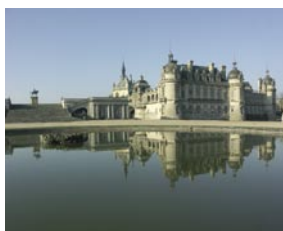
Grand Château (XIX e siècle)