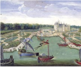
Chantilly vu du Vertugadin École française du XVII e siècle

Un château fort, propriété des Bouteiller de Senlis, est construit sur le promontoire rocheux au milieu des marais de la Nonette. Il contrôle une route venant de Paris et se dirigeant vers la Picardie.