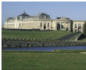
Grandes Écuries (XVIII e siècle)

1719 : Louis-Henri, duc de Bourbon, fait construire par son architecte Jean Aubert sur la base de l'ancien château fort un nouveau bâtiment de style classique ainsi que les Grandes Écuries. L'architecte met également en place l'urbanisme d'une partie de la ville de Chantilly.