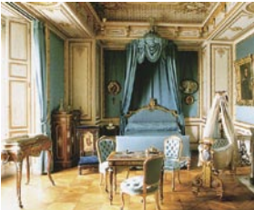
Les appartements privés

Les grands appartements se visitent uniquement avec un guide. Renseignez-vous à l'accueil du musée sur les heures de visite. Visite sans supplément.