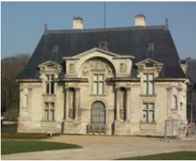
Petit Château (XVI e siècle)