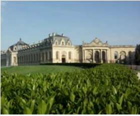
Grandes Écuries (XVIII e siècle)

1719 : Louis-Henri, duc de Bourbon, fait construire par son architecte Jean Aubert sur la base de l'ancien château fort un nouveau bâtiment de style classique ainsi que les Grandes Écuries. L'architecte met également en place l'urbanisme d'une partie de la ville de Chantilly.