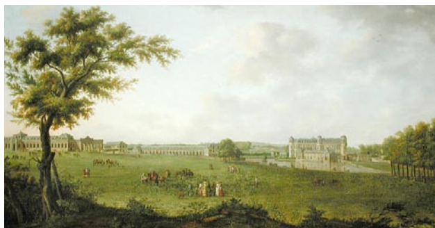
Chantilly en 1781, vue prise de la pelouse Henri de Cort