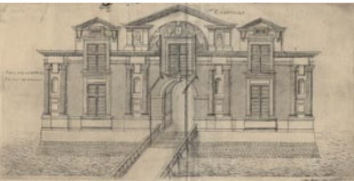
Gravure d'Androuet du Cerceau, 1579

Ordre architectural régnant sur plusieurs étages.