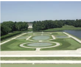
Parterre français d'André Le Nôtre (XVII e siècle)

Louis II de Bourbon, leur fils, dit «le Grand Condé», et cousin du roi, organise à Chantilly une vie de cour aussi brillante que celle de Versailles en conviant tous les plus grands artistes de son temps. C'est ainsi que Le Nôtre aménage de somptueux «jardins à la française».