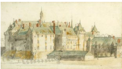
Chantilly vers 1665 par Van der Meulen