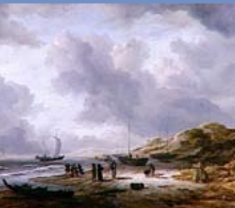
■ Van Ruisdael Jacob Isaakszoon (1628/1629-1682) La plage et les dunes de Schewengen Chantilly, musée Condé