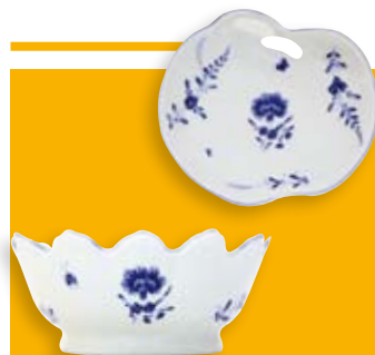
■ Porcelaine de Chantilly, œillet bleu

Pour tous renseignements et conseils, contactez-nous au 03 44 62 62 66.