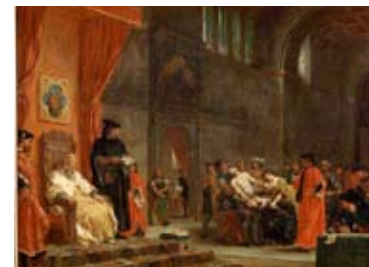
■ Eugène Delacroix (1798-1863)