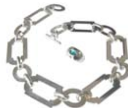
■ Bijoux collection Le Nôtre

Pour tous renseignements et conseils, contactez-nous au 03 44 27 31 82.