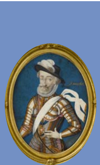
■ École française du début du XVIII e siècle Le roi Henri IV (1553-1610), 1605 Chantilly, musée Condé