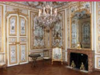
■ Les grands appartements - la Grande Singerie