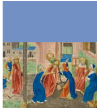
■ La mort de César, faits des Romains d'après Lucain, Suétone et Salluste Folio 261v

Textes théoriques, gravures des attentats et des supplices, actes de procédures et même « pièces à convictions » viendront éclairer les motivations, les faits et leurs conséquences.