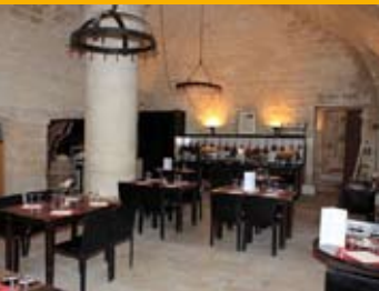
■ La Capitainerie